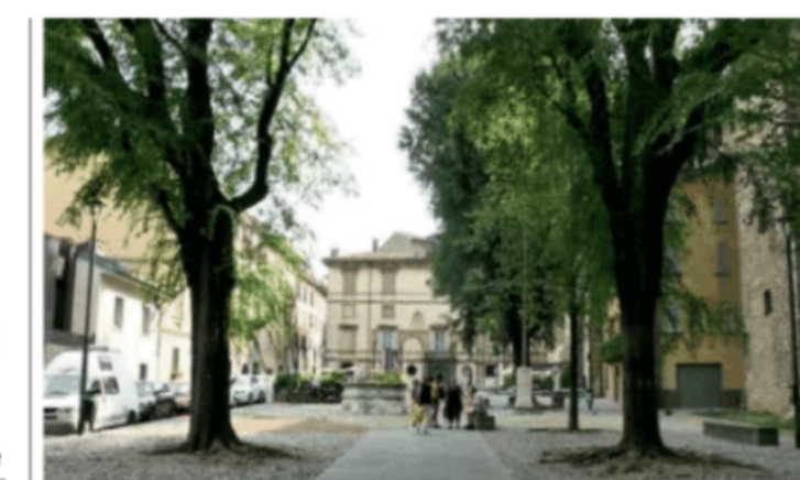
▲ Tesori urbani Piazza Mascheroni a Bergamo Alta, piccolo gioiello rinascimentale, è uno dei luoghi in cui si svolge il Landscape Festival

manifestazione internazionale dedicata alla promozione della cultura e della progettazione del Paesaggio, promossa da Arketipos e dal Comune di Bergamo. Il festival, già in corso dai primi del mese, occupa come di consueto la bella Bergamo Alta fino al 22 settembre. Tra gli appuntamenti più attesi, l'allestimento di piazza Vecchia,