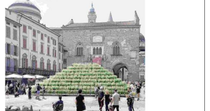
Un resting della piramide verde che verrà allestito in Piazza Vecchia