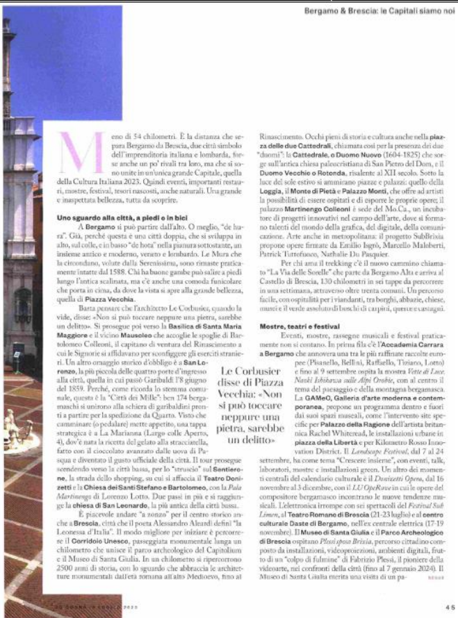
Bergamo & Brescia: le Capitali siamo noi

M eno di 54 chilometri. È la distanza che separa Bergamo da Brescia, due città simbolo dell'imprenditoria italiana e lombarda, forse anche un po' rivali tra loro, ma che si sono unite in un'unica grande Capitale, quella della Cultura Italiana 2023. Quindi eventi, importanti restauri, mostre, festival, tesori nascosti, anche naturali. Una grande e inaspettata bellezza, tutta da scoprire. Uno sguardo alla città, a piedi o in bici A Bergamo si può partire dall'alto. O meglio, "de barca". Già, perché questa è una città doppia, che si sviluppa in alto, sul colle, e in basso "de bona" nella pianura sottostante, un insieme antico e moderno, veneto e lombardo. Le Mura che la circondano, volute dalla Serenissima, sono rimaste praticamente intatte dal 1588. Chi ha buone gambe può valere a piedi lungo l'antica scalinata, ma c'è anche una comoda funicolare che porta in cima, da dove la vista si apre alla grande bellezza, quella di Piazza Vecchia.