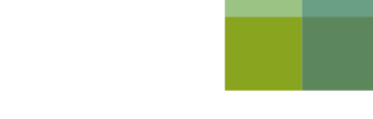
Un resting della piramide verde che verrà allestito in Piazza Vecchia