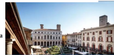
4 Il cuore della manifestazione è la Green Square nella Piazza Vecchia di Bergamo, un'opera di Martin Rein-Cano

Torna il festival che riflette sul binomio natura-architettura. In programma fino al 24 settembre, sbarca per la prima volta in entrambe le città per approfondire il tema "Grow Together", un invito a collaborare insieme per crescere meglio