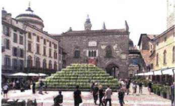
Dalle passate edizioni del festival Landscape

zioni dal vivo e aperitivi. Al centro è stato posizionato un grande tavolo, da cui emergono cipressi a formare una barriera che, via via diradandosi, permette ai partecipanti di guardarsi, conoscersi e socializzare. Oltre alle installazioni green il festival ha in programma decine di eventi per ogni tipo di pubblico: laboratori, atelier, aree didattiche, giochi e mostre pensate per i bambini e per le famiglie, in grado di coinvolgere educando al verde, al bello e alla sostenibilità. Per gli addetti ai lavori ci sono infine diversi appuntamenti, tra i quali l'International Meeting of Landscape and Garden, che riunisce architetti, paesaggisti, garden designer, botanici e plant designer che raccontano ciascuno la propria esperienza e filosofia progettuale attraverso lecture, talk e testimonianze video. Landscape Festival - I Maestri del Paesaggio, a Bergamo e Brescia dal 7 al 24 settembre, #landscapefestival2023, landscapefestival.it