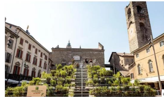
4 Man mano che le oltre 10mila piantine che ricoprono l'installazione saranno distribuite ai visitatori, lasceranno spazio a delle sedute per assistere eventi culturali

Grow Together , crescere insieme al paesaggio come persone, come comunità, come umanità, ma anche come città. Questo il tema di Landscape Festival - I Maestri del Paesaggio , la manifestazione promossa da Arketipos e dal Comune di Bergamo con il supporto del Comune di Brescia, che nell'anno di Bergamo Brescia Capitale Italiana della Cultura 2023, fino al 24 settembre porta per la prima volta in entrambe le città lombarde installazioni, eventi, workshop e masterclass volti a promuovere il ruolo sempre più centrale del paesaggio in favore di uno sviluppo sostenibile e della rigenerazione urbana, nonché l'armonia tra uomo, architettura e natura.