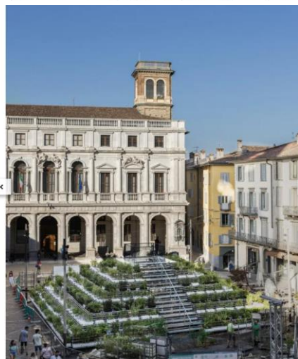
2 / 30 - Landscape Festival, Bergamo -Brescia

Sarà uno splendido autunno, all'insegna di mostre, concerti, spettacoli, regate, sport, passioni. Ecco una selezione dei migliori eventi dell'autunno 2023 in 13 città. Da Trieste a Napoli, passando per Torino, Venezia, Roma e Milano