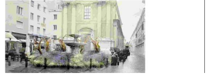
Un resting della piramide verde che verrà allestito in Piazza Vecchia